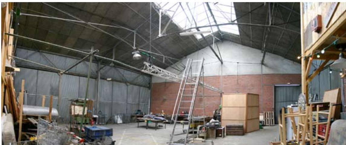
Le hangar des Subsistances

Il s'agit là d'un élément dans ce projet car cela permettra de faire circuler le projet au-delà des Subsistances et lui donnera ainsi une plus grande envergure.